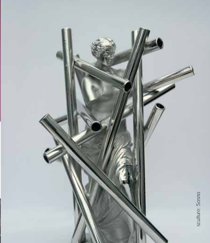
sculpture : Sosno