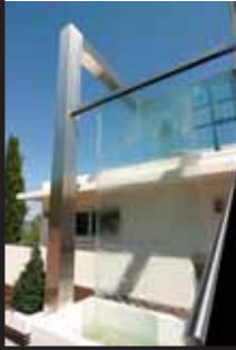
photo de couverture, Ralph Hutchings villa à la vente à l'agence Croisette California. Cannes