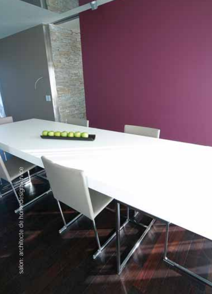
salon : architecte de homedesignservice