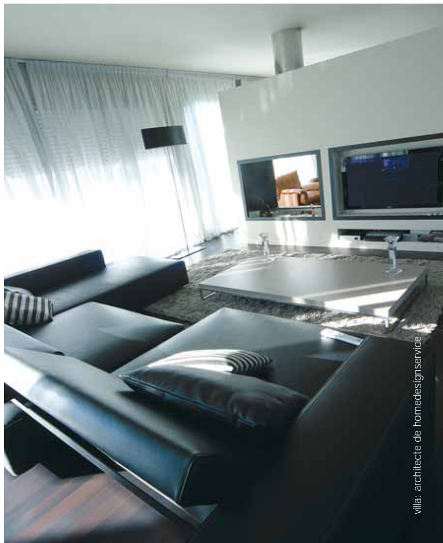
villa : architecte de homedesignservice